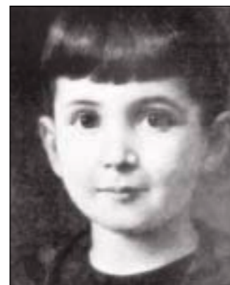
■ STEFAN ZWEIG aos 4 anos, em 1885, em Viena, Áustria