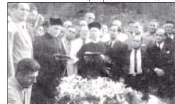
■ O ENTERRO do escritor, no cemitério de Petrópolis, em 1942. À direita, a capa do livro de Alberto Dines