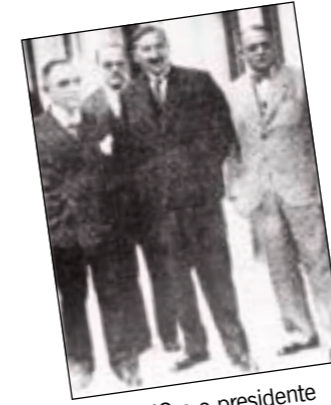
■ ZWEIG e o presidente Getúlio Vargas (à esquerda)